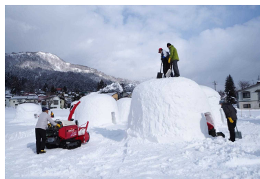
かまくら作りの様子

当初 4、5 人で地道な活動を続けていたところ、豪雪や寡雪の年も経る中で、徐々に活動に賛同してくれる有志が増え、平成 20 年に「かまくら応援隊」を設立しました。