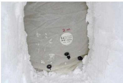
地元企業とのコラボ商品「かまくら君」

かまくら応援隊が作るかまくらは、「かまくら君」というバルーンを使用する独特な方法で造っています。