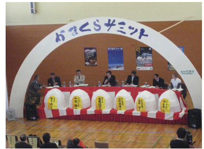
かまくらサミットの様子

かまくら祭りが第10回目を迎えた平成21年度には、記念イベントとして「全国かまくらサミット」を開催しました。雪国の地域づくりをテーマに、かまくらという雪国文化について、歴史ある秋田県横手市や長野県大町市のかまくら職人などにお越しいただき、かまくらという雪国の資源をお互いに再認識しました。