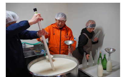
新たな取組、どぶろくづくり

平成 30 年度からは飯山市が認定を受けたどぶろく特区を活用して、地元の良質米コシヒカリを使った「どぶろく・かまくらの里」を、資格を有するかまくら応援隊員が醸造して、レストランかまくら村で提供するなど、常に新たな取組に挑戦しています。