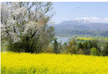
唱歌「朧月夜」の風情がそのまま残る菜の花公園

飯山市は、長野県の北部に位置し、市の中央に千曲川が流れ、西は新潟県上越市と妙高市に接する盆地にあります。唱歌「故郷」や「朧月夜」の舞台としても知られ、四季折々の様々な自然景観や人々の営みは、どこか懐かしく「日本の原風景」とも称されます。