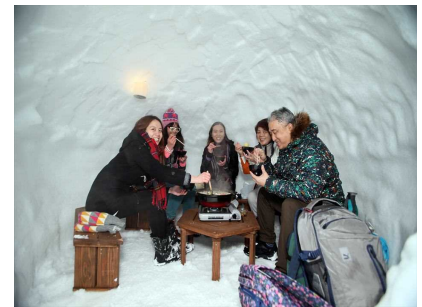
かまくらの中で食べるのろし鍋は外国人にも大人気

っており、かまくらのシーズンには鍋運びに従事するなど、レストランかまくら村は働く場、社会交流の場ともなっています。