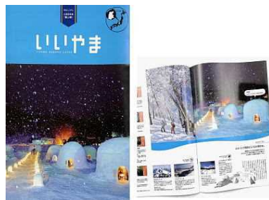
飯山市観光パンフレット

こうした状況から、今やかまくらは飯山市の観光パンフレットの表紙を飾るほか、信州いやま観光局の一押しキラーコンテンツに成長し、海外の旅行雑誌にも紹介されるようになりました。