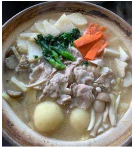
地元食材をたっぷり使ったのろし鍋

なお、地域のシンボルである黒岩山にかつて上杉謙信方ののろし台があり、ふたを開けた時の湯気の立ち上がり様子から、のろし鍋と名付けています。