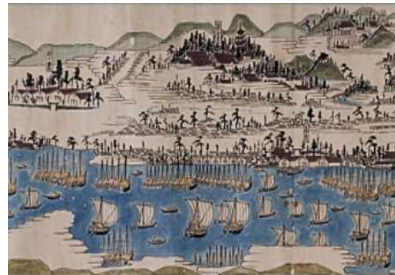
越前三国湊風景之図 (繁栄の様子)

道路網の発達による海運業の衰退によりその時間を止めることとなります。当時の繁栄の軌跡は、現存するかぐら建てのまちなみや 250 年の伝統ある「三国節」や「三国祭り」から感じることができます。