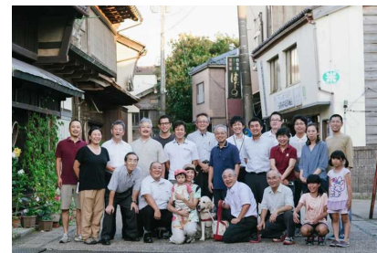
活動の原点は地域への「誇り」と「愛」

三國會所はこれからも、三国湊の誇りを次世代へと紡いでゆくため、重視してきた「稼ぐ力」をより一層、昇華させるとともに、幅広い連携力を発揮し生業への発展を目指していきます。