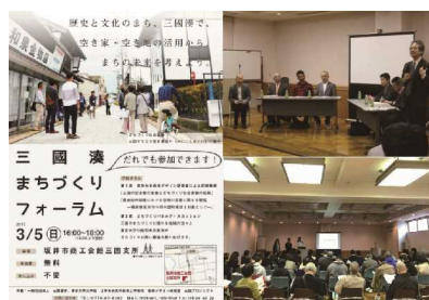
三国湊まちづくりフォーラムの開催

当団体が活動を開始して以降、取り組みが多岐にわたることで、住民が自分たちの住むまちの価値を再認識し、地域への誇りや愛着をもつ上で、大きな効果をもたらしています。また、住民に対して活動内容やまちの課題である「空き家」等の研究成果についてフォーラムを開催し、定期的に報告することで危機意識の共有に努めてきた結果、空き家の提供や利活用相談が着実に増加しています。