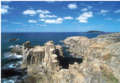
国天然記念物・名勝「東尋坊」

坂井市は、福井県嶺北地方の北部に位置し、平成 18 年 3 月に三国町・丸岡町・春江町・坂井町の 4 つの町が合併して誕生しました。東西約 32km におよび、東は雄大な山々、西は国天然記念物・名勝「東尋坊」に代表される壮大な越前海岸に面し、中部には福井県随一の穀倉地帯である肥沃な坂井平野が広がる自然豊かな地勢です。人口は、90,280 人(平成 27 年国勢調査)と県内 2 番目の規模であり、東洋経済新報社が毎年公表する「住みよさランキング」では、6 年連続トップ 10 を記録しています。