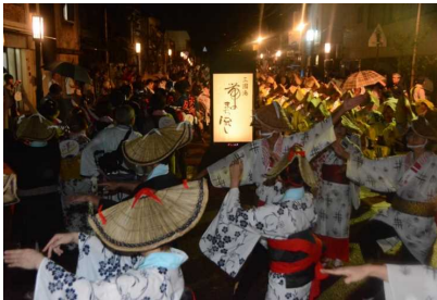
まちなかを踊り流す「三国湊帯のまち流し」

さらには市外および県外の団体が参加する等活動の輪が広がっています。平成28年度の参加者数は、19団体延べ520人を数え、古の湊町が醸成してきた文化の保存や知名度向上に大きく寄与しています。また、フォトコンテストを同時開催することで、多くのカメラマンが来場し、対外的な露出にも貢献しています。